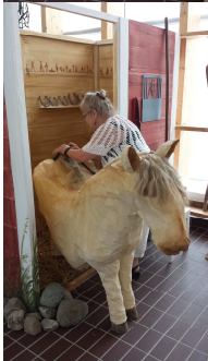
Hästens man och pannlugg tillverkad av lin från Skånelin. Shetlandsponnyn är gjord i papier-mache och är/var utställd på Möllegården Åkarp. Tillverkare Monica Gueffin