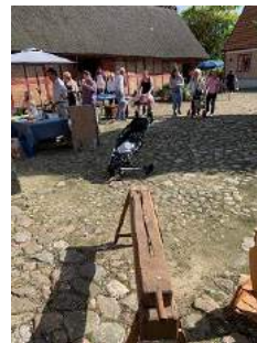
Text och bild Monika