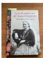
Text och bild Monika