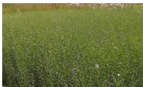
Text och bild Eva

till våren 2022 eftersom förfrågan redan gjorts