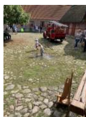
Text och Bild Monika Olsson

igen för vi är så välkomna och vi blir också informerade om att Bråkan är utställd till oss, skönt dom har en egen så vi slipper släpa med oss ifrån Knutstorp.