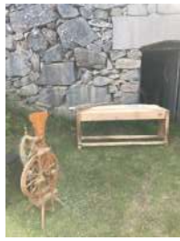
Text och bild Eva Olsson