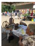
Text och bild Eva Olsson