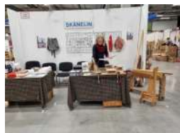
Text och bild Monika Olsson