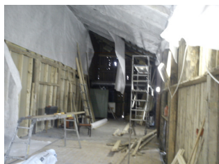
Arbete i full gång Brydestuan, Knutstorp