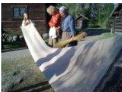
Bilderna ovanifrån nr 1, 2 tagna av Inge Schwagermann Bild nr 3 och 4 från Skansen i Stockholm Linet odlat hos Karin Persson Norra Strö