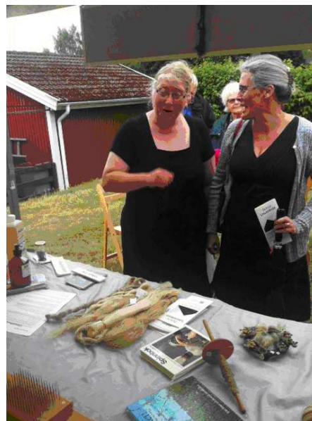
Intresserade besökare i Näsium