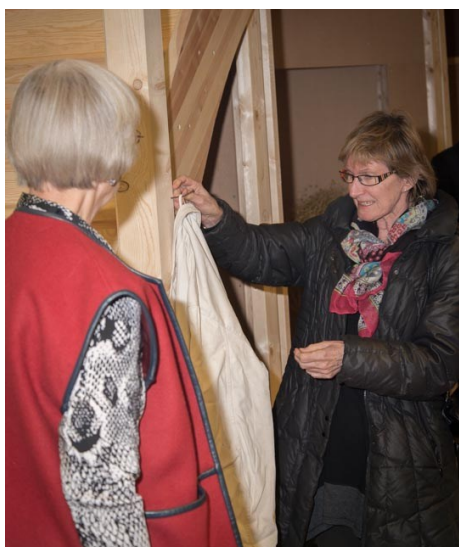
Rocken hängs på plats