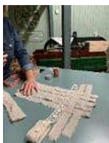
Kuddarna pryder sin plats.