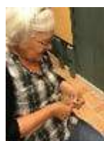
FOTO FRÅN VÅRENS SPINNKURS